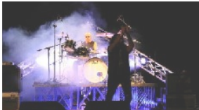
La leggenda del rock Ian Paice a WoodinStock per un concerto solidale contro il Parkinson al Teatro Sociale 6 Dicembre 2018 In "Musica"