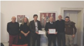
Donazioni ed anticipazioni dell'impegno sociale WOODinSTOCK 7 Febbraio 2018 In "No Profit"