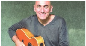
WoodinStock: Teatro Sociale Busto Arsizio 10 Febbraio 2018 In "Spettacoli"